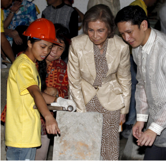
SM la Reina atiende a las explicaciones de una joven filipina, durante su visita a una escuela taller financiada por España en Manila, durante su visita en julio de 2012.