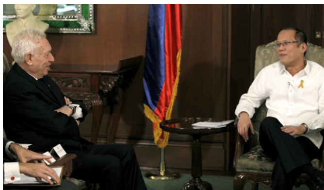
El anterior ministro de AA.EE y de Cooperación José Manuel García-Margallo, durante el encuentro con el entonces presidente de Filipinas, Benigno Aquino, celebrado en Manila en marzo de 2014.

Tribunal Arbitral dictaminó que las Islas Spratly no generan zona económica exclusiva alguna ni de forma separada ni como conjunto archipelágico, encontrándose algunas de las mismas dentro de la ZEE de Filipinas. En ese sentido, el Tribunal Arbitral entendió que China había violado los derechos soberanos de Filipinas en su zona, incluidos los de pesca en torno al Bajo de Masinloc (Scarborough Shoal). Por último, el TA estableció que China causó graves daños a los arrecifes coralinos al construir estructuras artificiales en las Islas Spratly que son incompatibles con las obligaciones de un estado parte en la mencionada Convención sobre el Derecho del Mar.