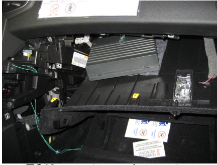
TC60 en parte superior guantera