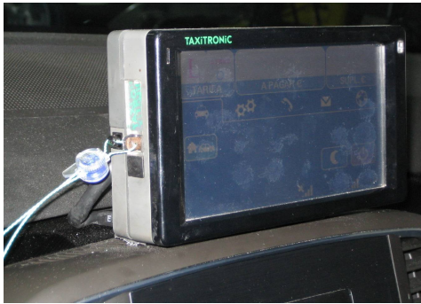
Precintos de montaje y cambio tarifas

En el costado derecho existe un precinto adhesivo del fabricante que impide el acceso a la electrónica. En caso de deterioro o reparación serán repuestos por el instalador.