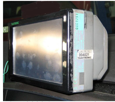
Precinto del fabricante acceso electrónica