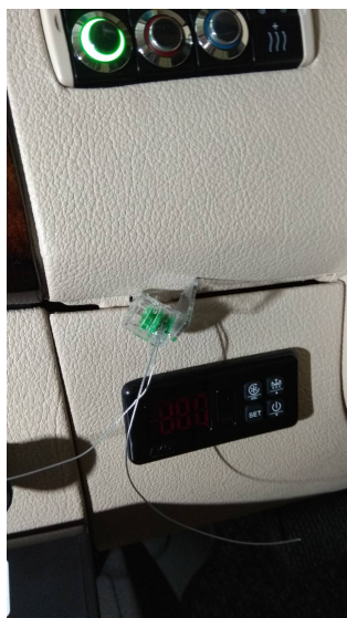
Precinto toma señal

La toma de señal de velocidad será la indicada por el fabricante del vehículo. En este caso la señal parte de un sensor de revoluciones de la rueda delantera izquierda y se localiza detrás del cuadro de instrumentos. Se realiza la toma de la señal y se precinta un tornillo de desmontaje del cuadro de instrumentos. El precinto queda visible en el salpicadero a la izquierda del volante abajo: