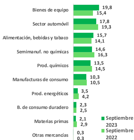
Gráfico 1: Exportaciones de la Comunitat Valenciana (% sobre total)